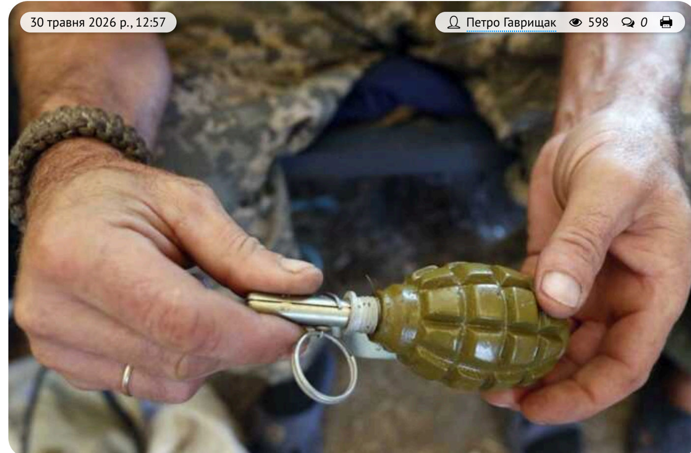
На Київщині затримали чоловіка з гранатами та набоями вдома

Поліція Броварського району Київщини затримала 38-річного жителя села Требухів, який зберігав у себе вдома арсенал вибухівки. У нього вилучили корпус гранати Ф-1, два корпуси РГН, підривачі та патрони різного калібру.