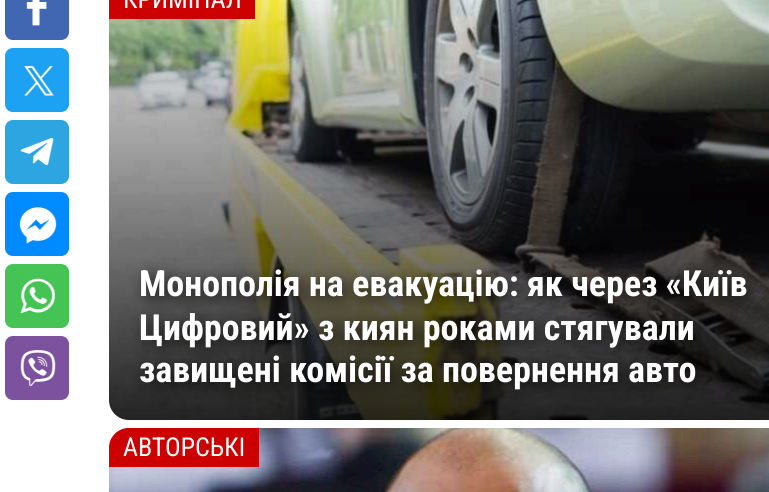
Монополія на евакуацію: як через «Київ Цифровий» з Києва розкази стегували завищені комісії за повернення авто