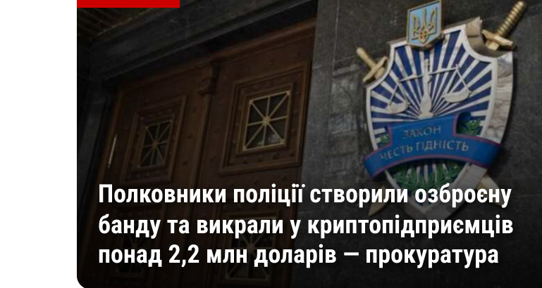
Полковники поліції створили озброєну банду та викрали у кримилодірисиців понад 2,2 млі доларів – прокуратура