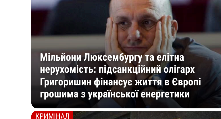
Мільйони Поксенбурту та шпана нерухомість: підсвічуємо підпис Григоріши фінансує життя в Європі грошима з української енергетики