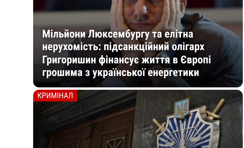
Мільйони Люксембургу та елітна нерухомість: підсанкційний олігарх Григорійшия фінансує життя в Європі грошиами з української енергетики