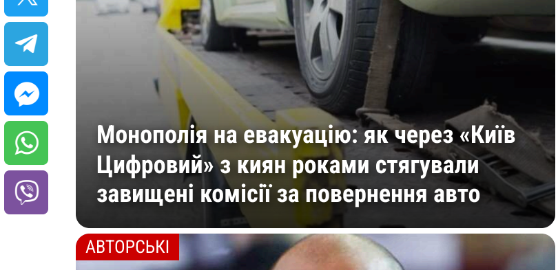
Монополія на евакуацію: як через «Київ Цифровий» з київ роками стигували завідцями комісії за повернення авто