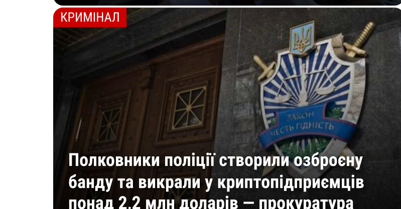
Полковники поліції створили озброєну банду та викрали у криптопідприємців понад 2,2 млн доларів – прокуратура