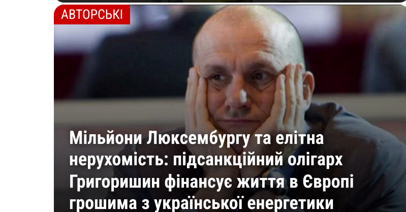
Мільйони Люксембургу та елітна нерухомість: підсанкційний олігарх Григорішин фінансує життя в Європі грошима з української енергетики