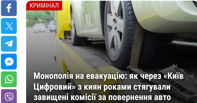
Монополія на евакуацію: як через «Київ Цифровий» з киян роками стягували завищені комісії за повернення авто

«Династія» – це недобудоване котеджне містечко на чотирьох приватних резиденції площею приблизно тисячу квадратних метрів кожна і спільний будинок зі спальною, басейном та спортзалом, у Козині, елітному передмісті Києва. Слідчі оцінюють ринкову вартість восьми гектарів землі, на якій велось будівництво, в $6