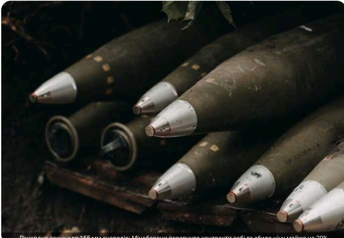
Рекордна закупівля 155-мм снарядів: Міноборони повернуло контракти собі та збило ціну майже на 20%

«Агенція оборонних закупівель» Міноборони законтрактувала «найбільшу в історії агенції» партію далекобійних снарядів натівського калібру 155 мм. Про це повідомив міністр оборони Михайло Федоров в своєму фейсбуці .