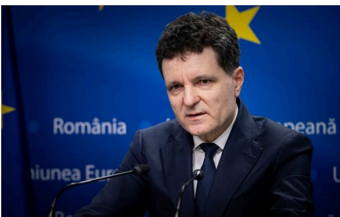
Фото: Нікушор Дан (Getty Images)

Не витрачай час на шум! Читай тільки суть з РБК-Україна у Google