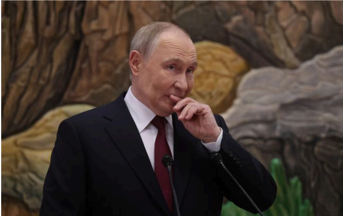
Фото: російський диктатор Володимир Путін