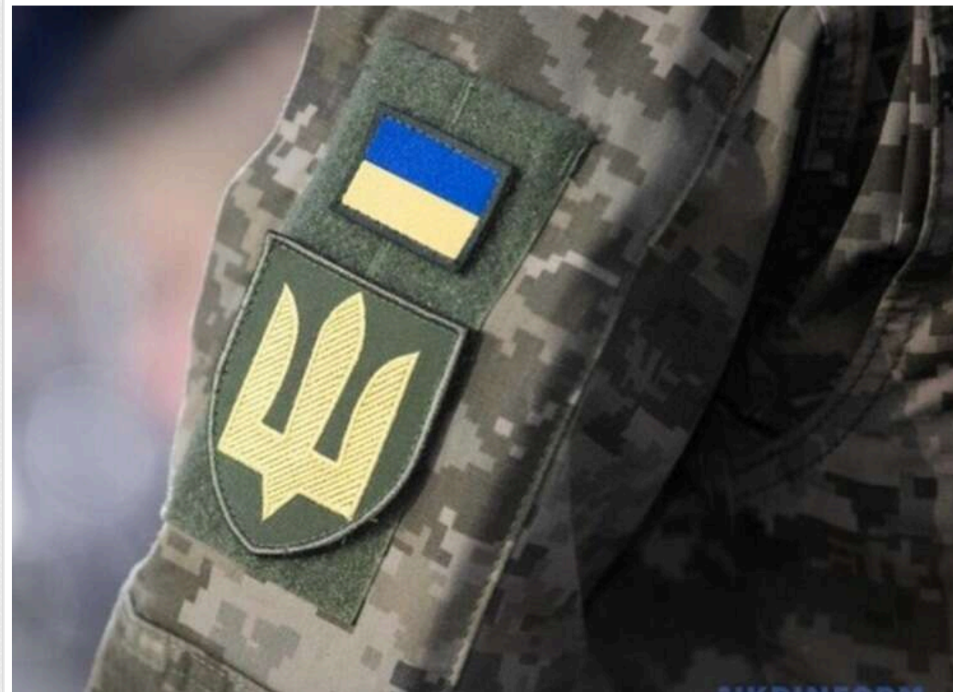
Спали по черзі: нардеп Федієнко розповів про жахливі умови в ТЦК, звільнення військомів і «магічний» ефект перевірок

У частині територіальних центрів комплектування військовозобов'язані змушені перебувати у неналежних умовах – без достатньої кількості спальних місць, нормального харчування та елементарного облаштування. Водночас після перевірок ситуація в окремих ТЦК почала швидко змінюватися – туди оперативно завозили ліжка, організували харчування та покращували умови для людей.