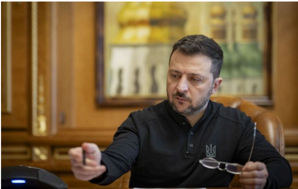
Фото: Володимир Зеленський, президент України (facebook.com/zelenyykyy.official)