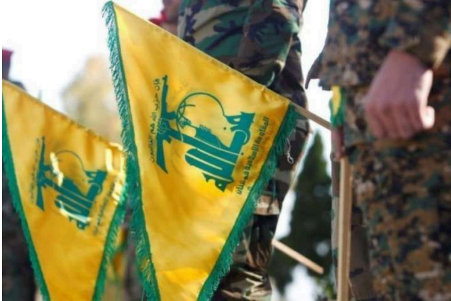
Прапор "Хезболли"

Ліванське угруповання «Хезболла» почало активно застосовувати новий тип FPV-дронів з оптоволоконним керуванням, використовуючи тактику, яка набула поширення під час війни в Україні, повідомляє BBC .