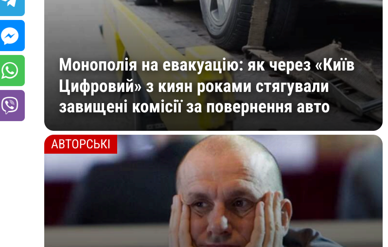
Монополія на евакуацію: як через «Київ Цифровий» з киян роками стягували завищені комісії за повернення авто