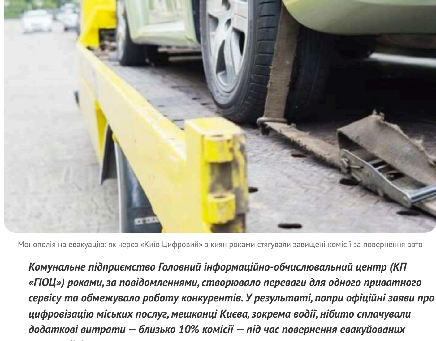
Монополія на евакуацію: як через «Київ Цифровий» з киян роками стягували завищені комісії за повернення авто

Комуністичне підприємство Головного інформаційно-обчислювального центру (КП «ГІОЦ») роками, за повідомленнями, створювало перепати для одного приватного сервісу та обмежувало роботу конкурентів. У результаті, попри офіційні заклики про цифровізацію міських послуг, мешканці Києва, зокрема водії, нібито сплачували додаткові втрати – близько 10% комісії – під час повернення евакуйованих автомобілів.