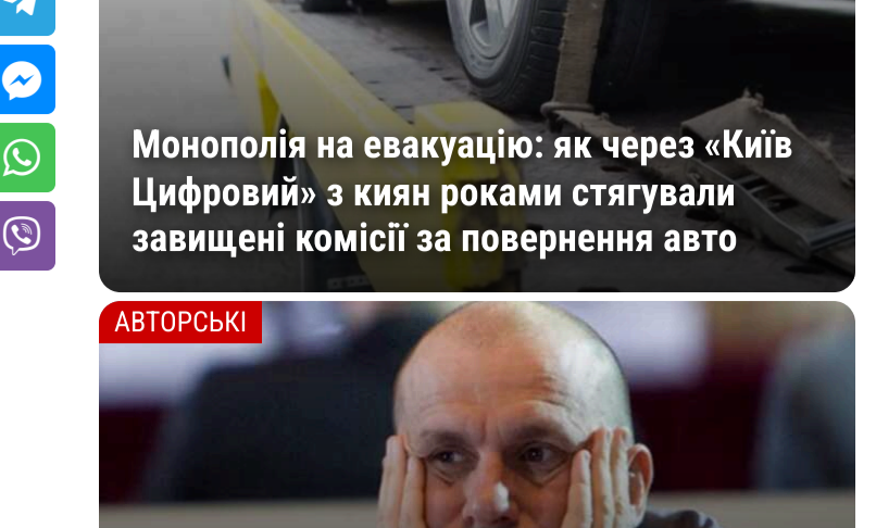
Монополія на евакуацію: як через «Київ Цифровий» з киян роками стягували завищені комісії за повернення авто