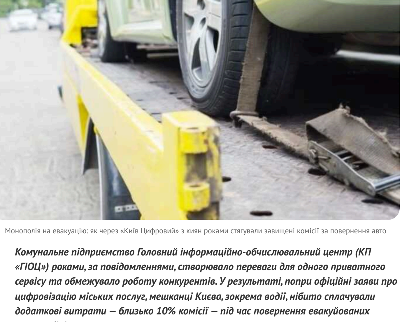
Монополія на евакуацію: як через «Київ Цифровий» з киян роками стягували завищені комісії за повернення авто

Комуністичне підприємство Головного інформаційно-обчислювального центру (КП «ГІОЦ») роками, за повідомленнями, створювало перешкоди для одного приватного сервісу та обмежувало роботу конкурентів. У результаті, проти офіційні заяви про цифровізацію міських послуг, мешканці Києва, зокрема водії, нібито сплачували додаткові втрати – близько 10% комісії – під час повернення евакуйованих автомобілів.