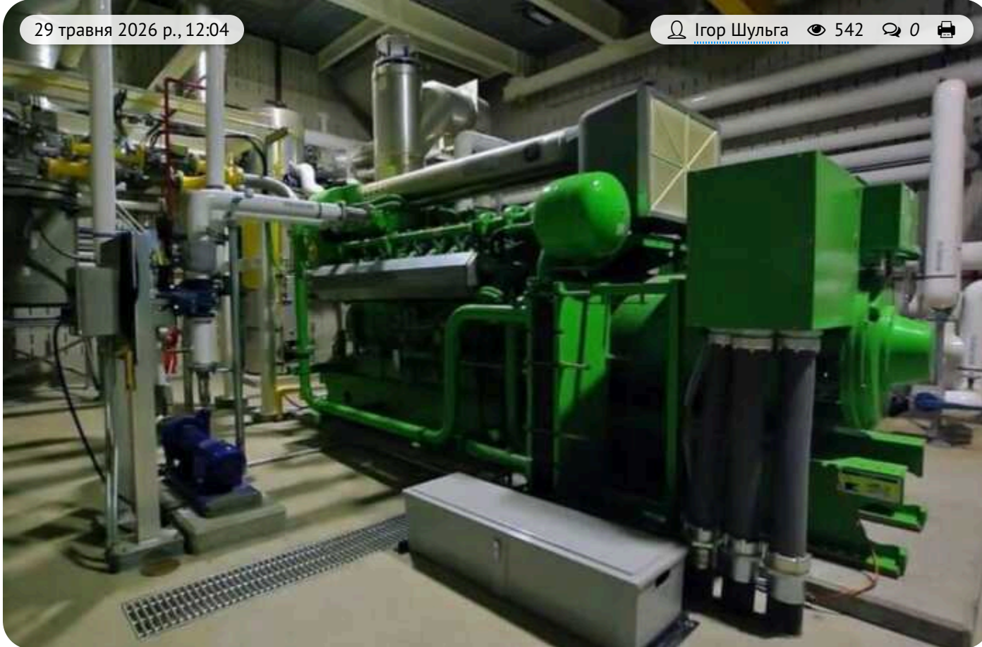
У Філатова замовили чеські когенераційні установки на 260 мільйонів гривень без конкурсу: ціна виявилася вищою за аналогічні закупівлі держави

КП «Коменергосервіс» Дніпровської міської ради 18 травня замовило у компанії RSE s.r.o. когенераційні установки на суму 5,08 млн євро (близько 260,40 млн грн без ПДВ).