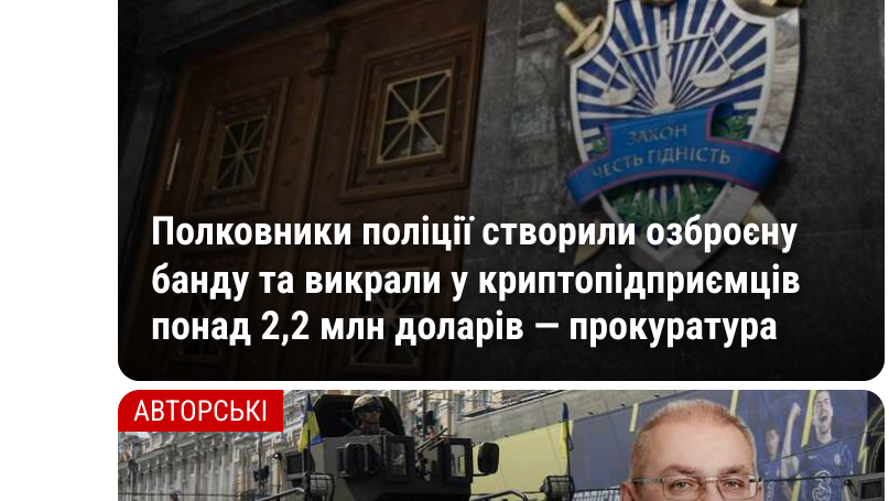
Поліцейські створили сфальшовану банку та вилучили у криптопідприємців понад 2,2 млн доларів — прокуратура