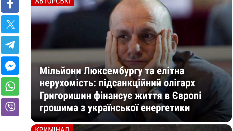
Мільйони Люксембургу та елітна нерухомість: підсанкційний олігарх Григорийн фінансує життя в Європі грошима з української енергетики