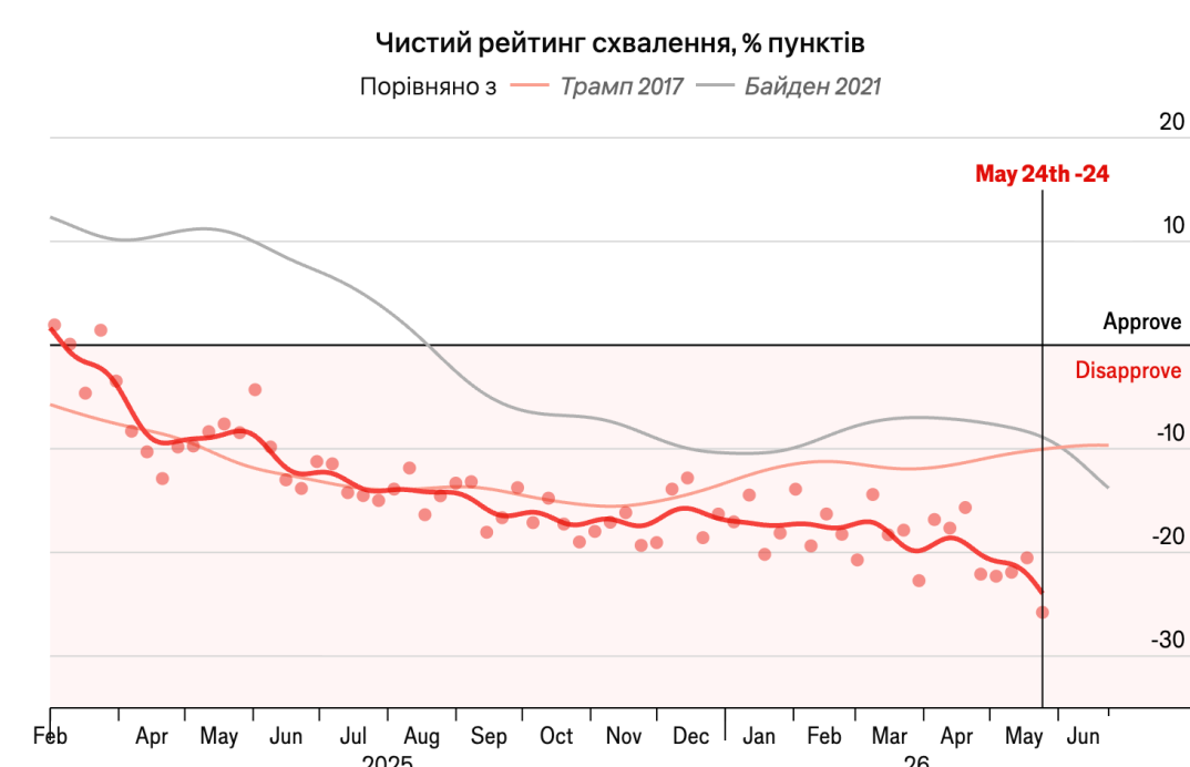
Фото: чистий рейтинг схвалення Дональда Трампа (інфографіка The Economist)

Таким чином Трамп став найнепопулярнішим президентом США з 2009 року, коли The Economist та YouGov розпочали регулярний моніторинг громадської думки щодо діяльності американських президентів.