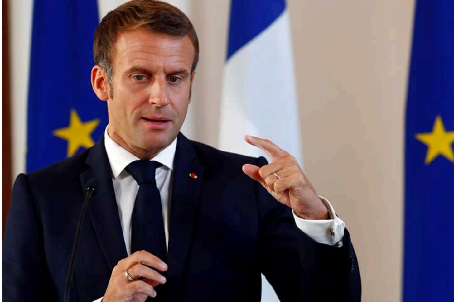
Фото: Еммануель Макрон

Прем'єр-міністр Норвегії Йонас Гар Стере та президент Франції Еммануель Макрон підписали оборонну угоду, яка, зокрема, передбачає приєднання Норвегії до французької ініціативи у сфері ядерного стримування, повідомляє Reuters.