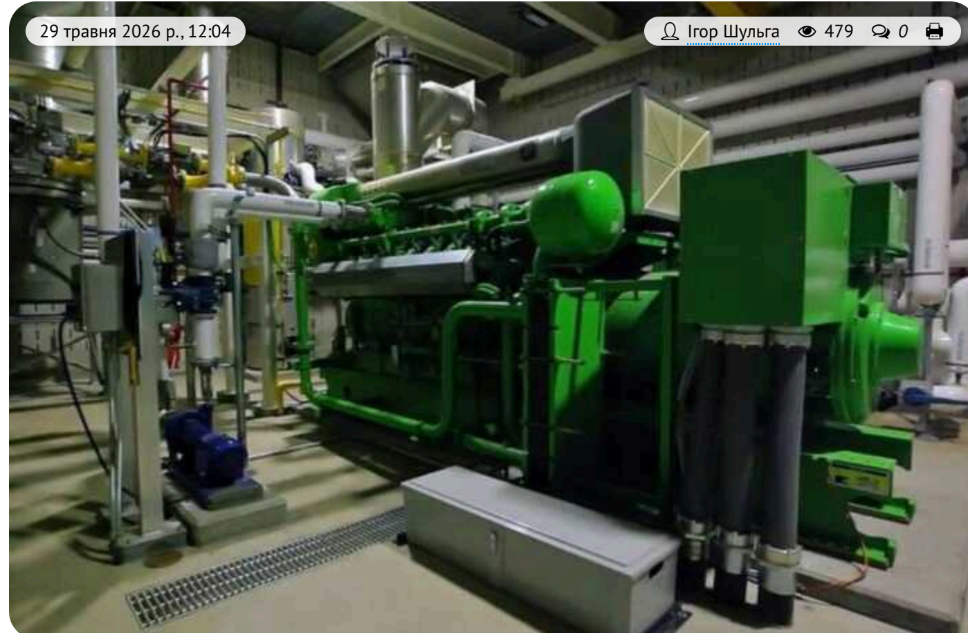
Закупівля в Дніпрі: когенераційні установки з Чехії обійшлися на 5% дорожче за альтернативи

КП «Коменергосервіс» Дніпровської міської ради 18 травня замовило у компанії RSE s.r.o. когенераційні установки на суму 5,08 млн євро (близько 260,40 млн грн без ПДВ).