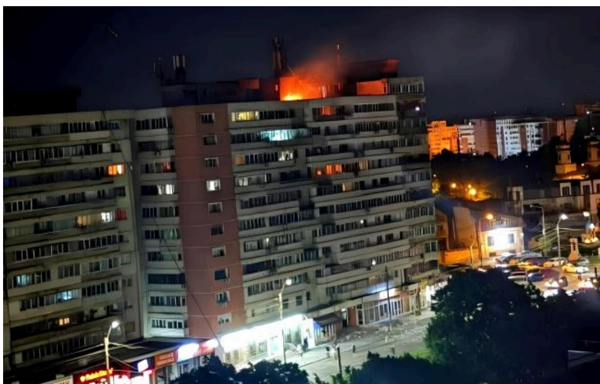
Фото: Захід відреагував на удар дрона по румунському Галаці (x.com/sentdefender)