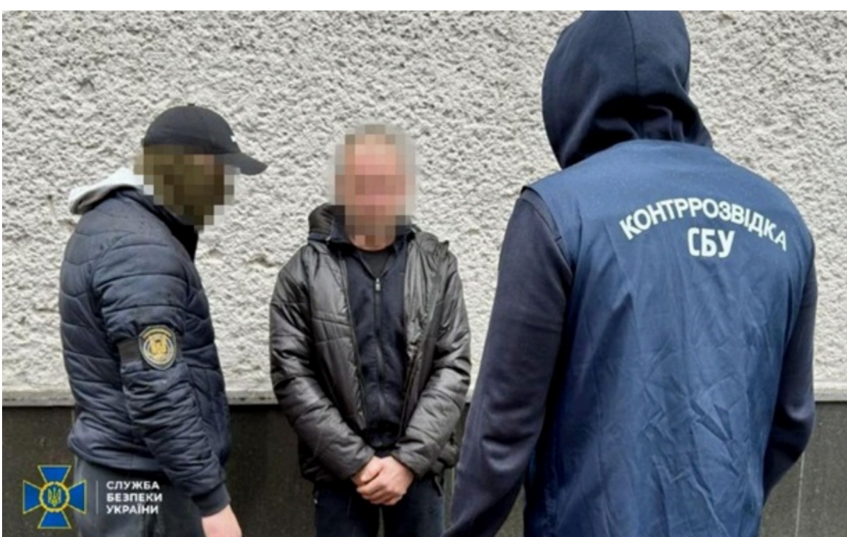
Агенту загрожує довгоче позбавлення волі з конфіскацією майна

У разі виконання завдання російській спецслужбісти обіцяли коригувальнику "евакуацію" до РФ.