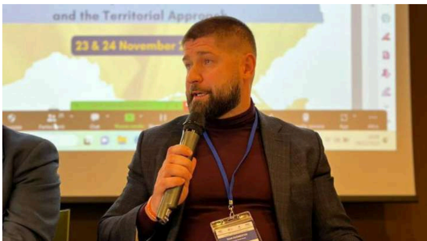
Іван Кузнецов

Заступник мера Харкова з питань забезпечення життєдіяльності міста Іван Кузнецов став учасником дорожньо-транспортної пригоди, у якій загинув мотоцикліст. Про це повідомив «Інтерфакс».