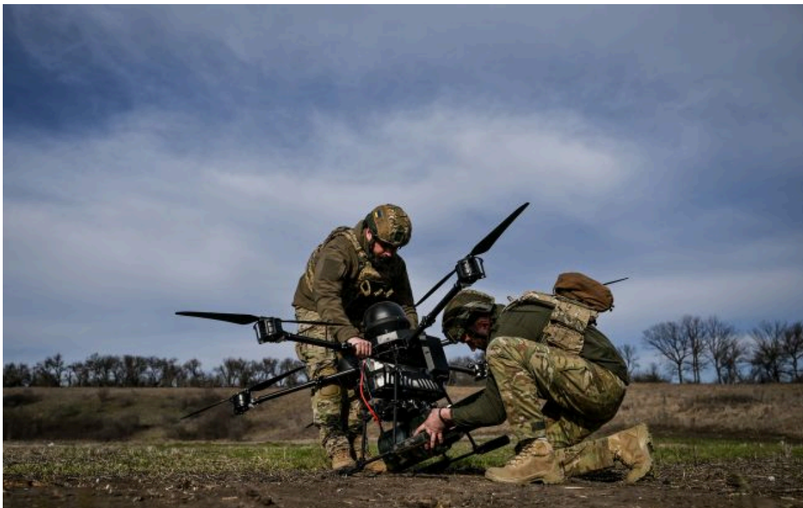
Фото: Сили Оборони з важким бомбардувальником-дроном (Дмитро Смоленко Укрінформ)