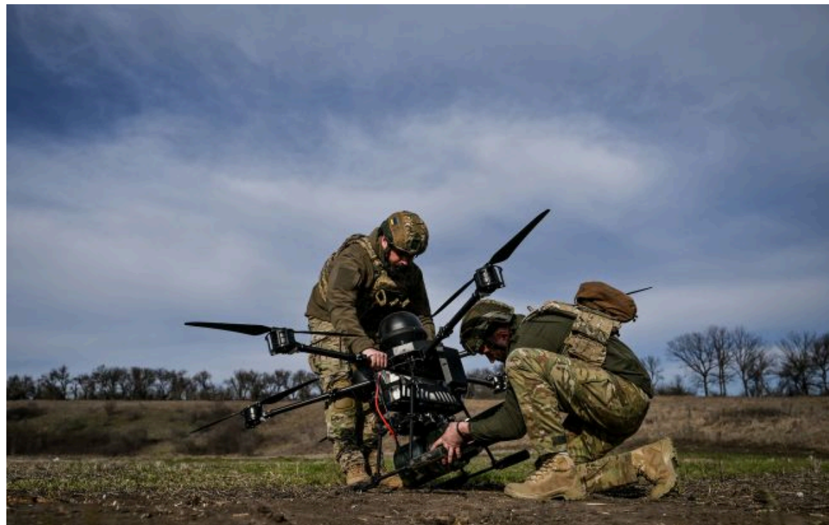
Фото: Сили Оборони з важким бомбардувальником-дроном (Дмитро Смоленко Укрінформ)