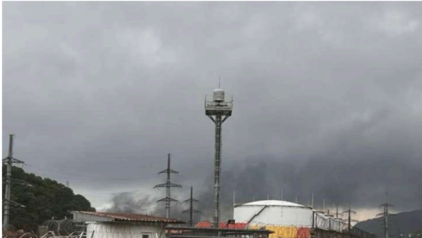
Фото: Дим у Туапсе після ударів по НПЗ

Сили оборони України завдали серії ударів по військовій та інфраструктурній цілі на території Росії та тимчасово окупованих територіях України, зокрема по нафтопереробному заводу в Туапсе, а також об'єктах у Воронежі та Таганрозі. Про це у четвер, 28 травня, повідомили в Генштабі ЗСУ.