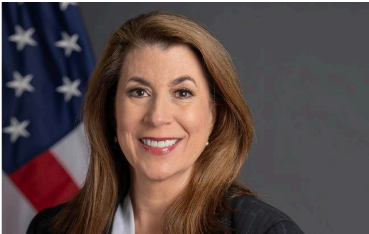
Фото: Теммі Брюс (Getty Images)

Розумій ситуацію на фронті через факти, а не чутки з РБК-Україна у Google