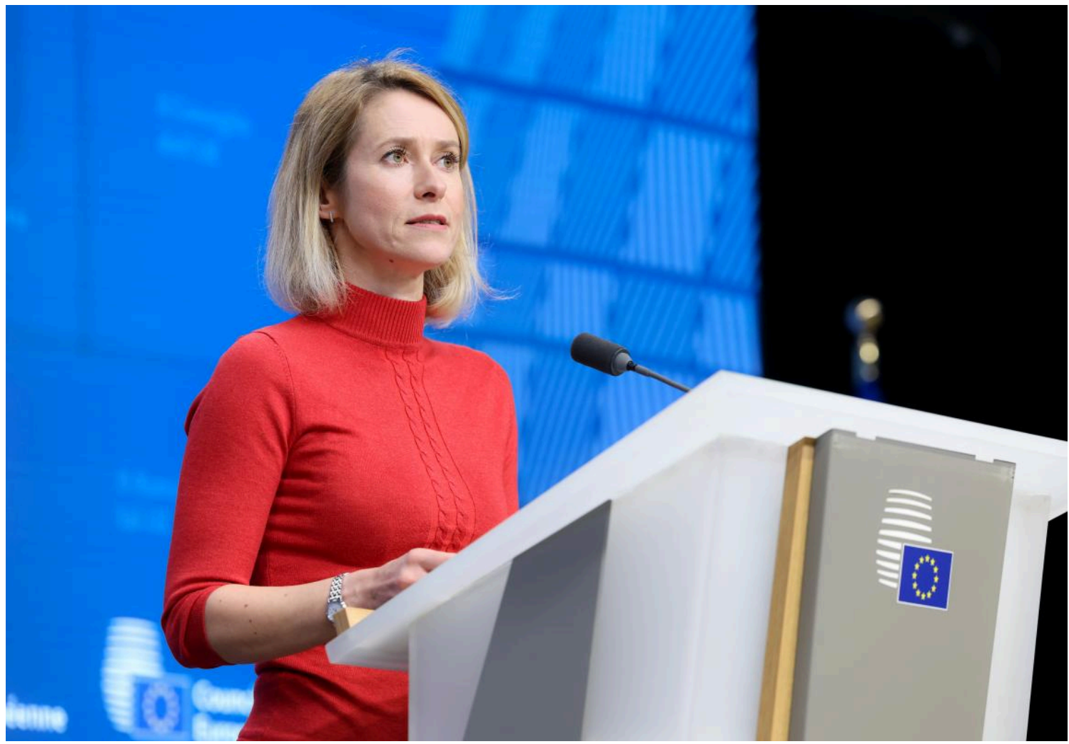
Глава дипломатії ЄС назвала "червоні лінії" у переговорах з Росією

Євросоюз не здатен однаково ставитися до обох сторін війни, заявила глава європейської дипломатії Кая Каллас.