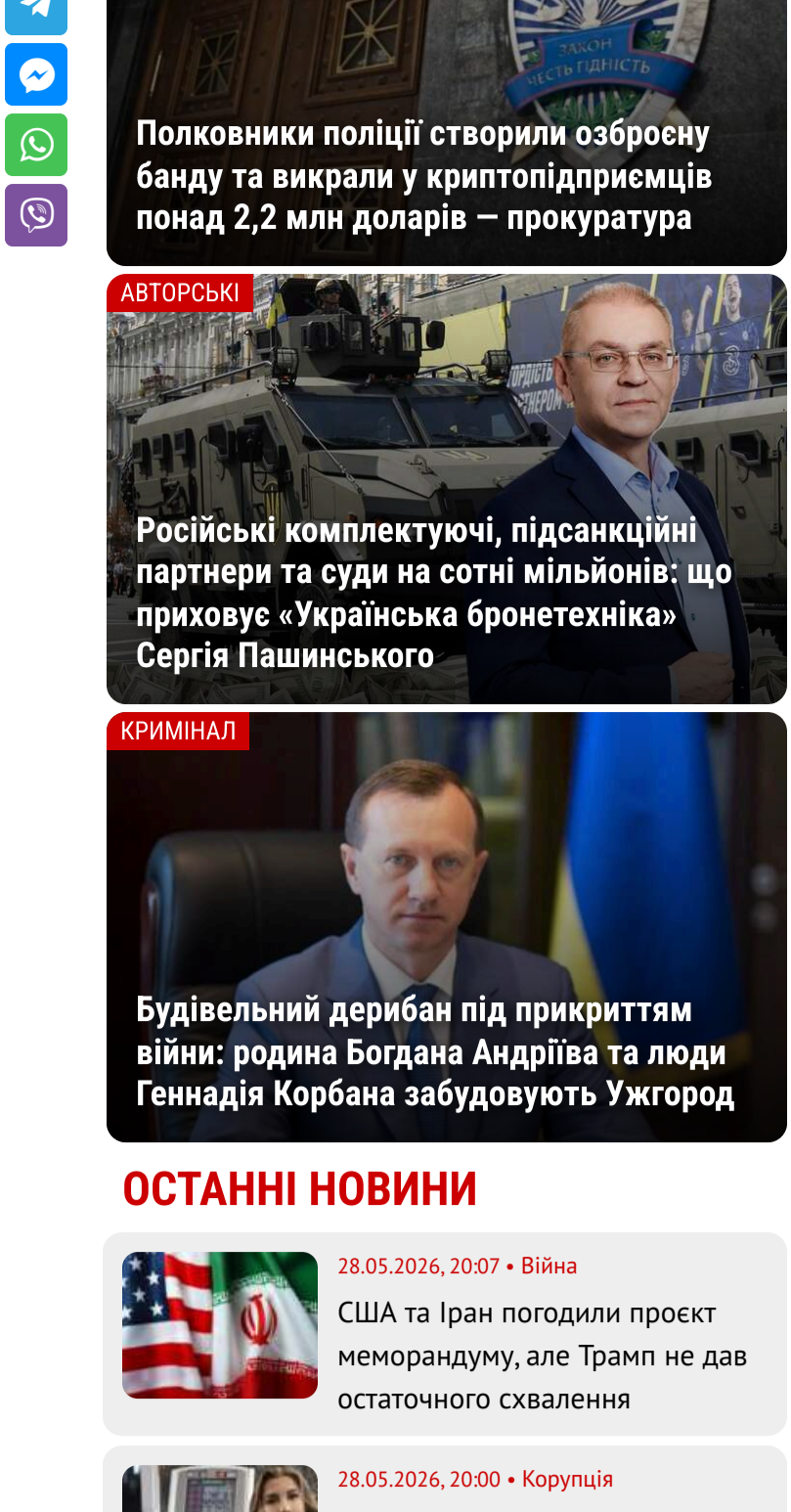
Попковники поліції створили озброєну банду та вкрали у криміалдірмісціце понад 2,2 млі долларів – прокуратура

«У мене немає жодних інших намірів, я просто хочу допомогати Україні. Будь ласка, не робіть тих помилку, які ми робили у Франції, у Європі. Я не кажу, що зараз є масове завезення трудових мігрантів. Я кажу: уповільню цей процес, поки не пізно», – пояснює Нікола Амбер непоганою українською з виразним