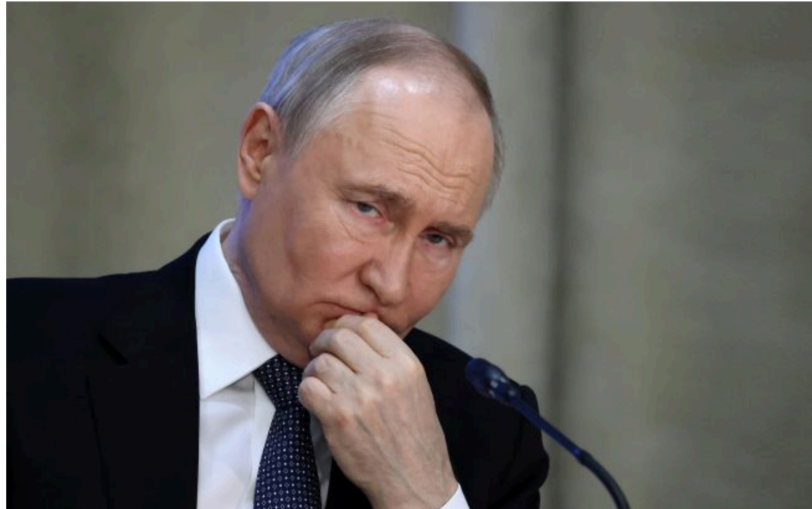
Фото: російський диктатор Володимир Путін (Getty Images)