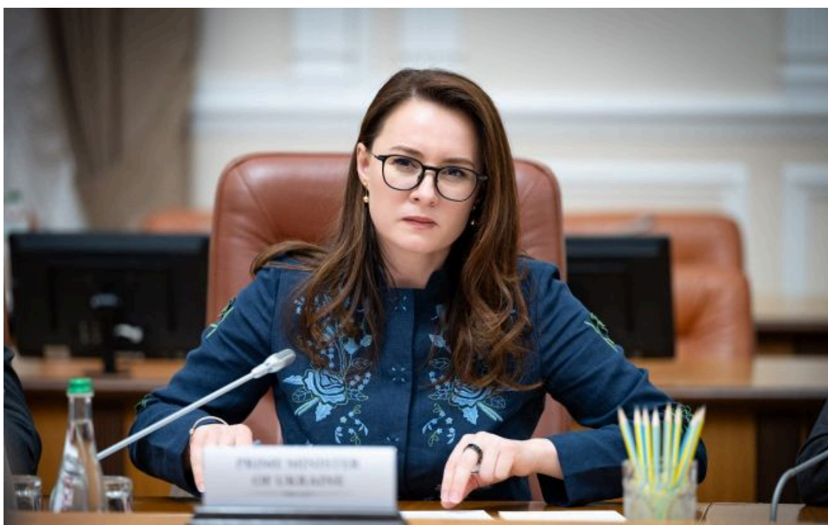
Фото: прем'єр-міністерка України Юлія Свиріденко