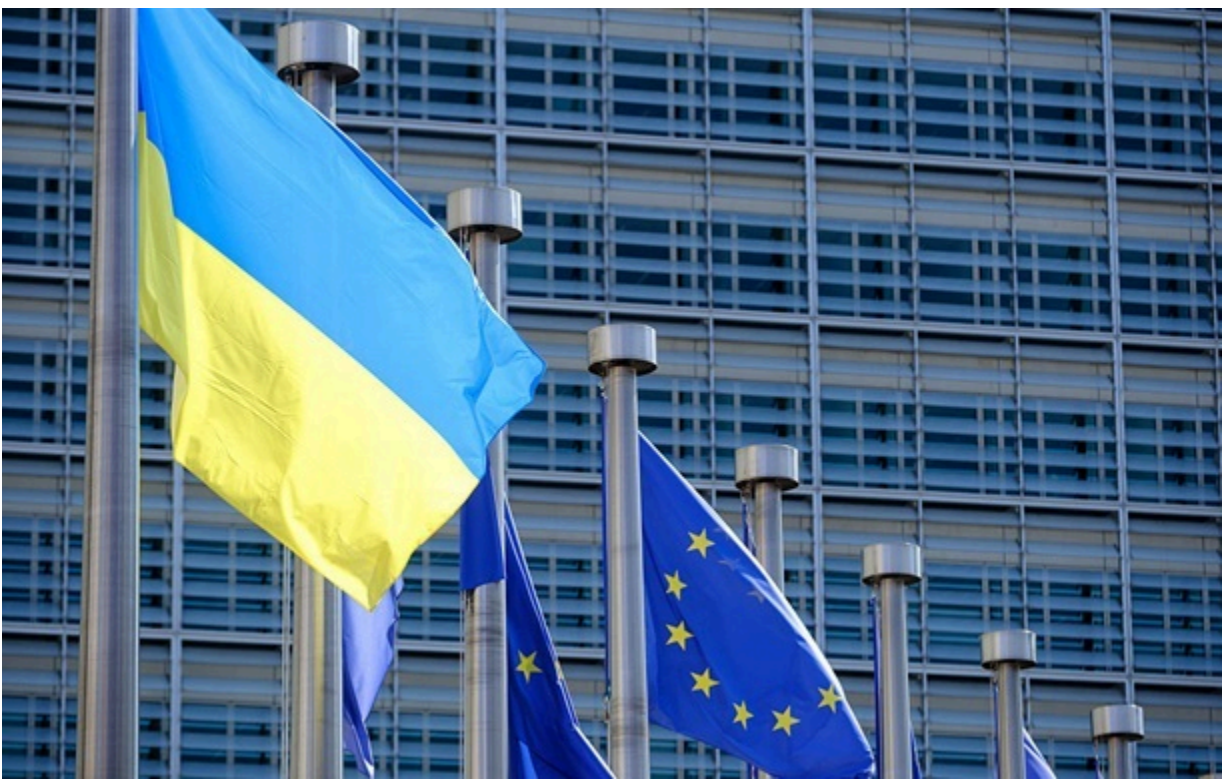
Україна отримує величезну допомогу від ЄС

Єврокомісія позитивно оцінила виконання Плану України за четвертий квартал 2025 року, зазначили в Кабміні.