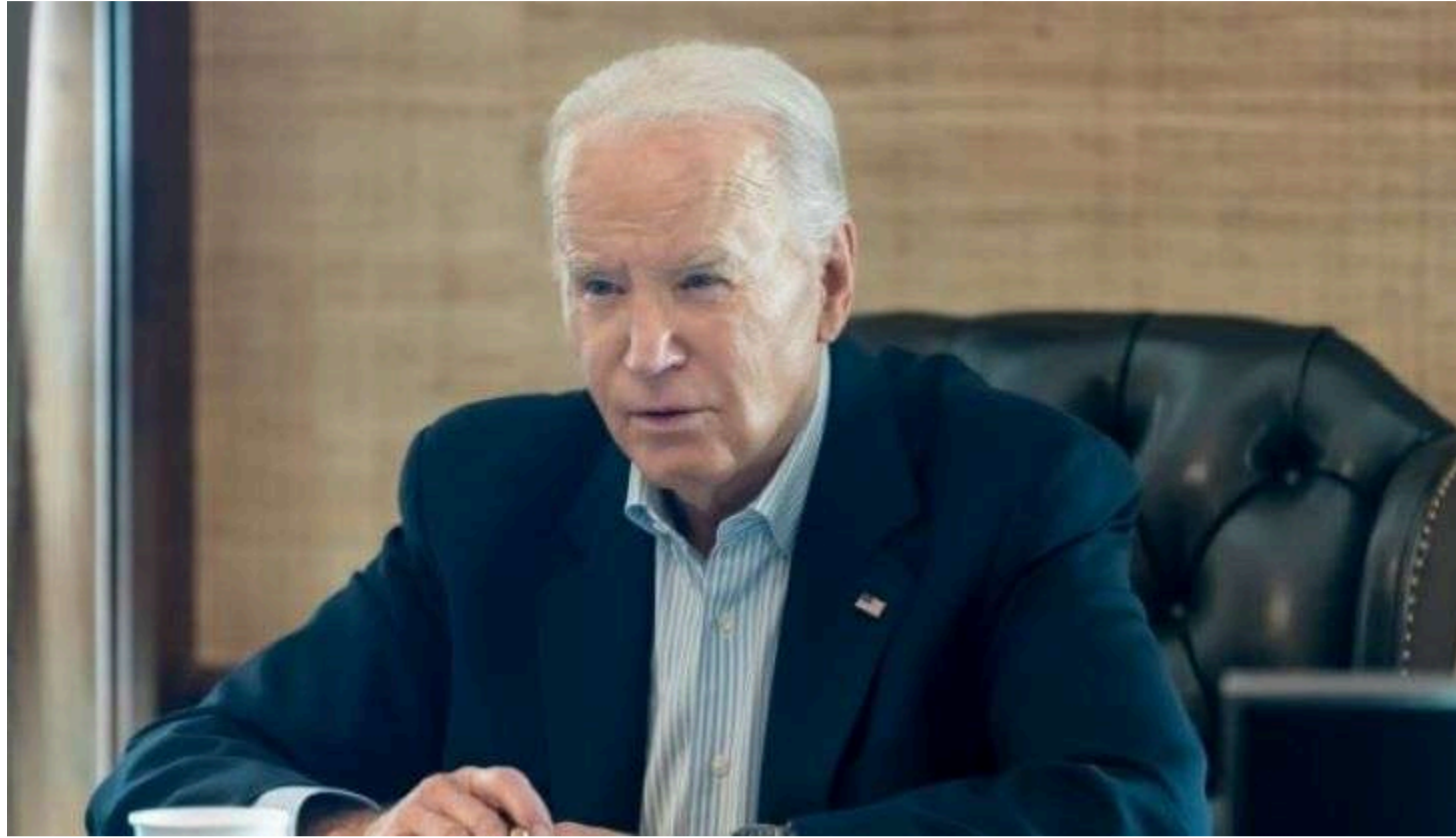
Фото: Джо Байден/White House

Колишній президент США Джо Байден подав до суду на міністерство юстиції через плани оприлюднити записи його біографічних інтерв'ю. Його позов оскаржує передачу приватних матеріалів до американського Конгресу, повідомляє CBS News .