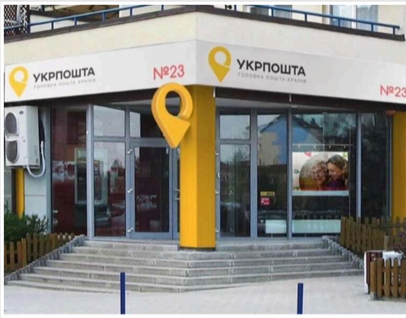
Посилки без операторів: «Укрпошта» встановить спеціальні бокси у 400 відділеннях по всій країні

“Укрпошта” впроваджує всередині відділень спеціальні комірки для пришвидшеної видачі, щоб клієнти могли отримати посилку, не стоячи в загальній черзі до оператора.