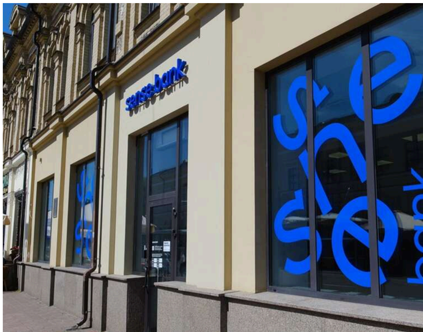
Спадщина Фрідмана в держбанку: як «Сенс Банк» злив 150 мільйонів підряднику із доведеною корупційною схемою

Тендерна змова в держбанку: як «Сенс Банк» передав 150 мільйонів рублів афілійованому підряднику.