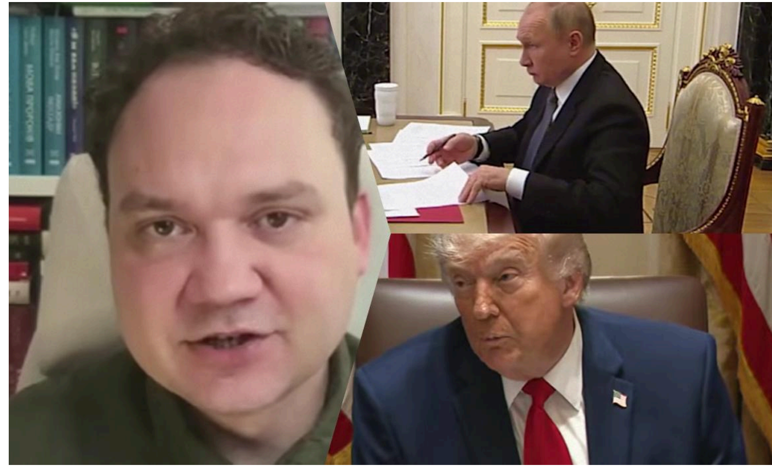
Мусієнко зауважив, що далекобійні удари України – це елемент активної оборони, який прекрасно працює

Путін просить Трампа вплинути на Україну, аби українські захисники не били по РФ.