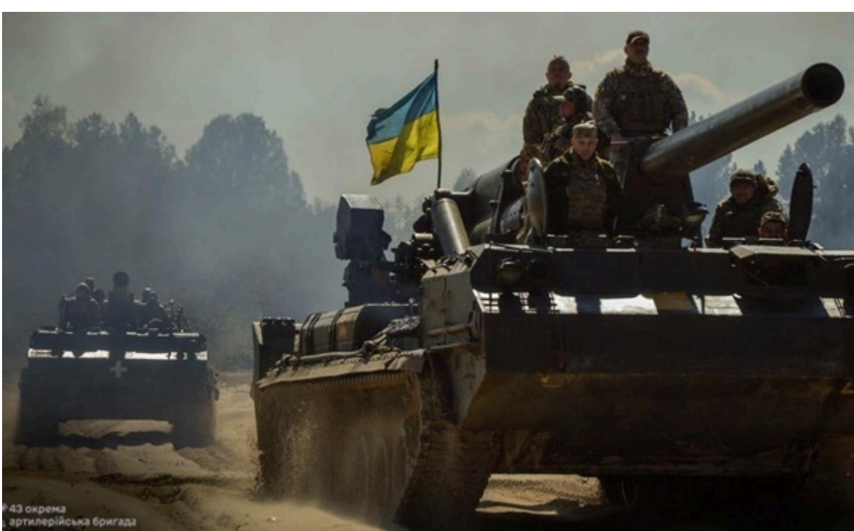
Фото: 43 ОАБр Україні потрібні мільярди на війну

Ці гроші накопичилися завдяки податку на доходи фізичних осіб, а також ліцензійним зборам від грального бізнесу та лотерей.