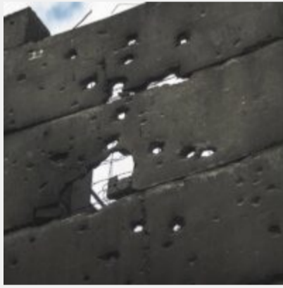
Як виглядає українська ТЕЦ, що пережила не одну ракетну атаку російських загарбників