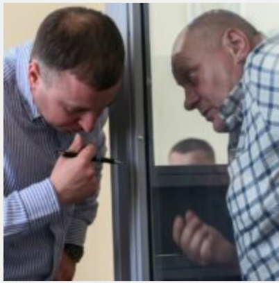
Бюджетні тисячі доларів для віртуальних вебкам-студій: як полковники Нацполіції трьох областей погоріли на порно