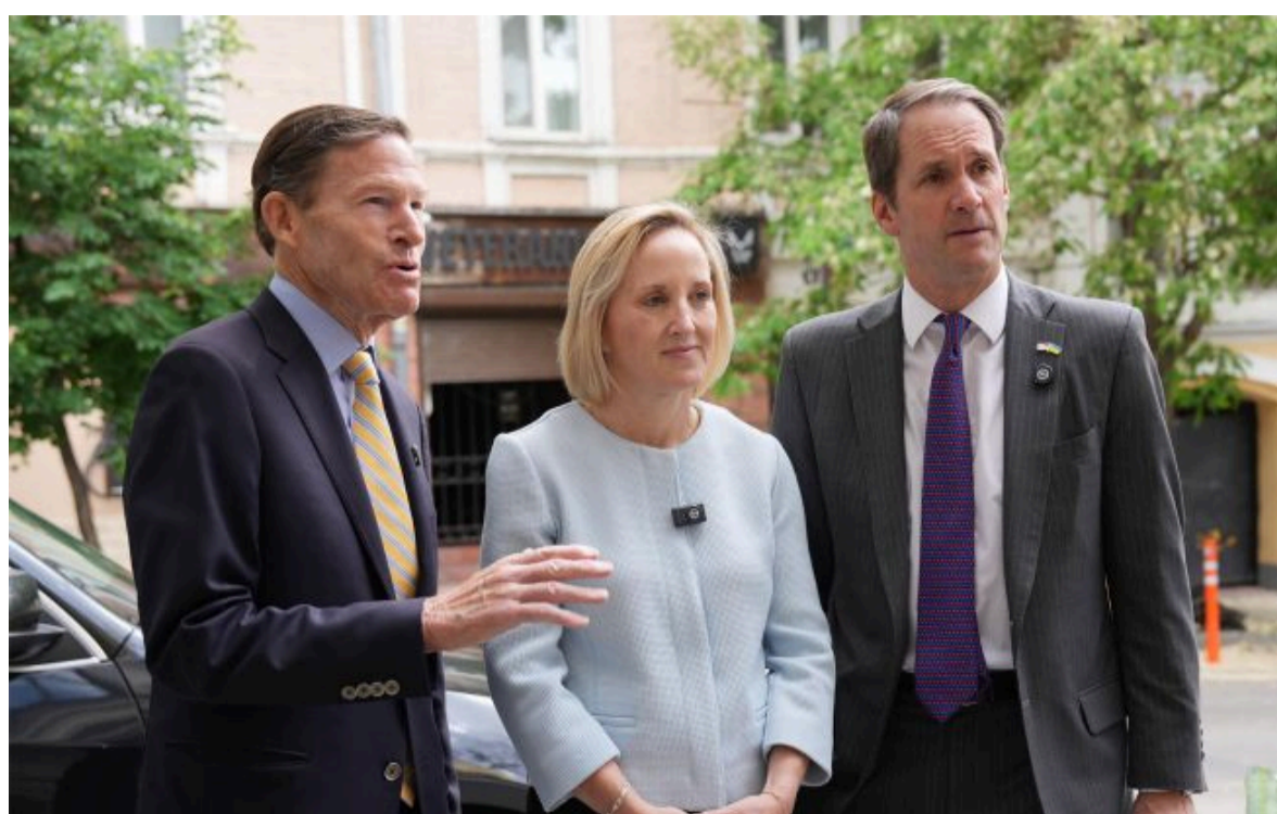
Фото: у посольстві США офіційно спростувала заяву про евакуацію

Не витрачай час на шум! Читай тільки суть з РБК-Україна у Google