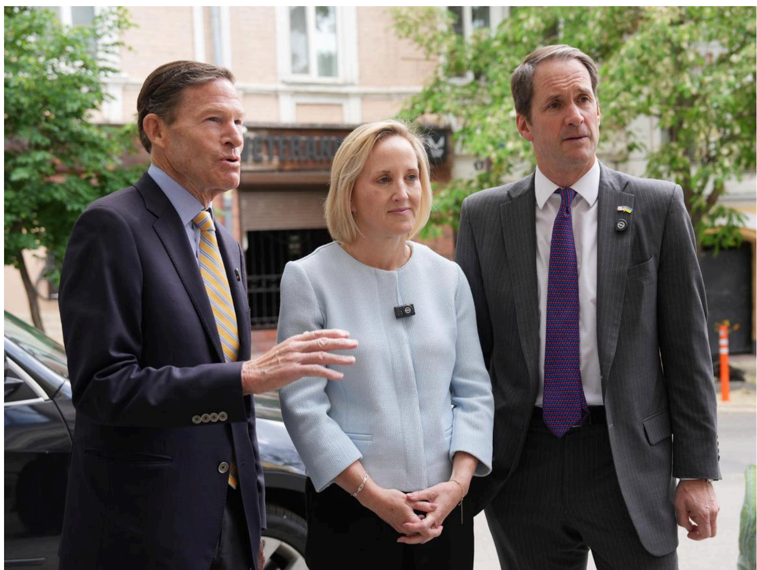
Посольство оприлюднило фото дипломатів

Водночас, американські дипломати радять своїм громадянам не їхати до України.