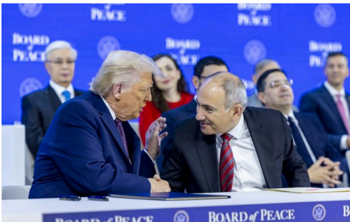
Фото: президент США Дональд Трамп та прем'єр Вірменії Нікол Пашинян