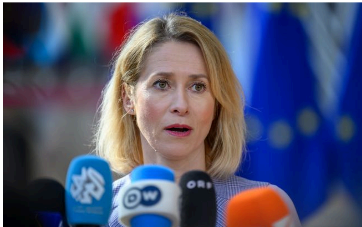
Верховний представник ЄС із закордонних справ Каї Каллас

Не витрачай час на шум! Читай тільки суть з РБК-Україна у Google