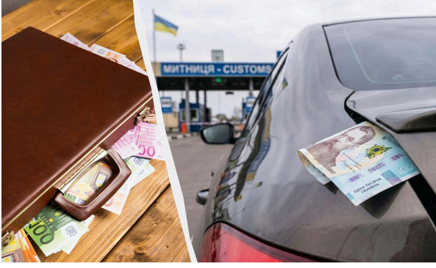
Деякі суми готівки потрібно декларувати перед вивезенням за кордон

Виведення коштів за кордон наразі обмежене через воєнний стан, але це все ще можна зробити цілком легальними способами.