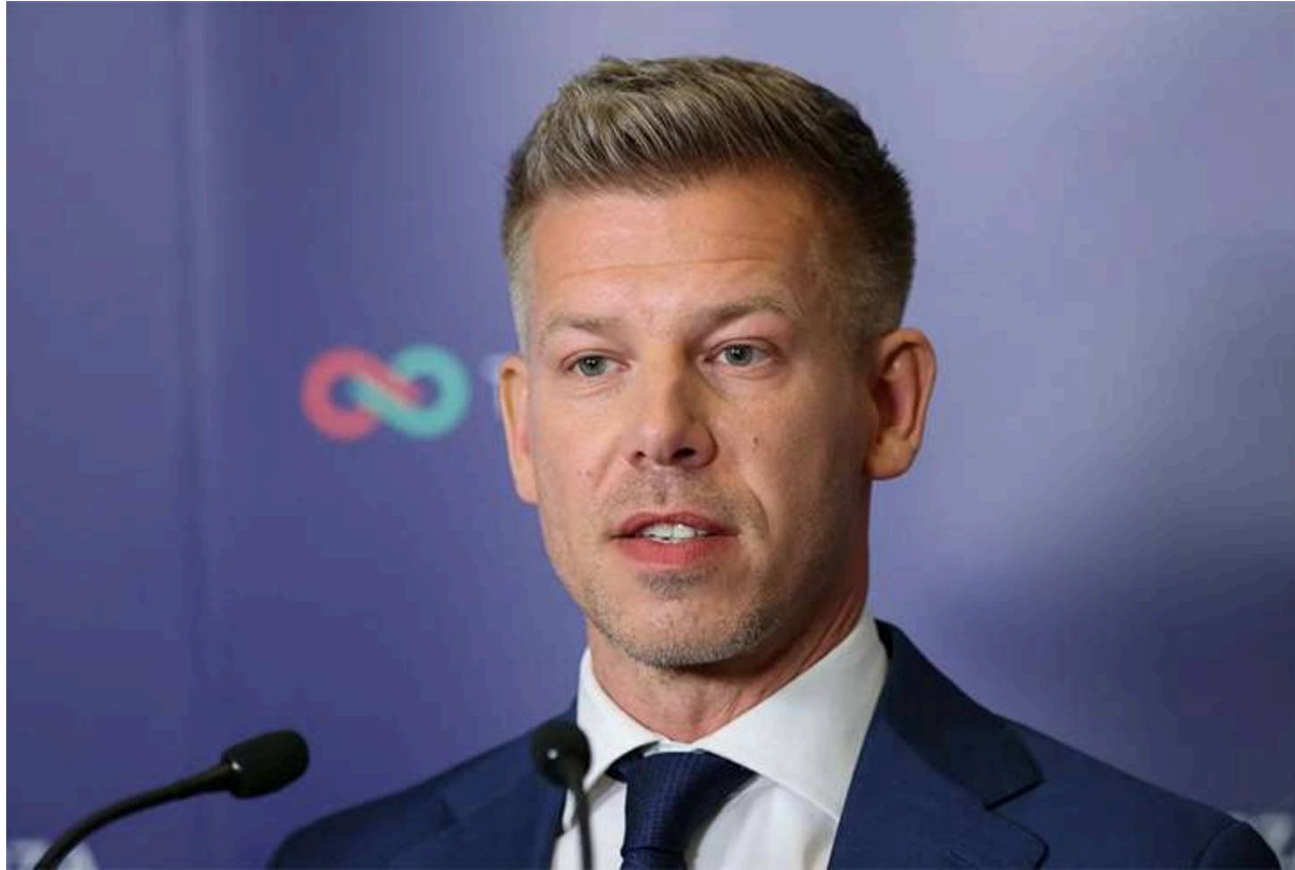
Петер Мадяр

Національна асамблея Угорщини підтримала законопроект, який скасовує вихід країни з Міжнародного кримінального суду (МКС). Про це повідомляє угорське медіа Telex.