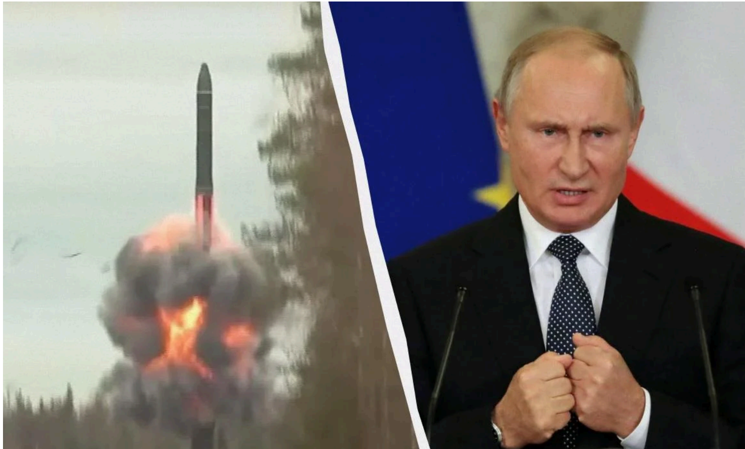
"Орешник" став черговим приниженням для Путіна

Москва представила "Орешник" як засіб, здатний змінити хід війни, проте справжні революційні розробки зазвичай не потребують такої наполегливої реклами.