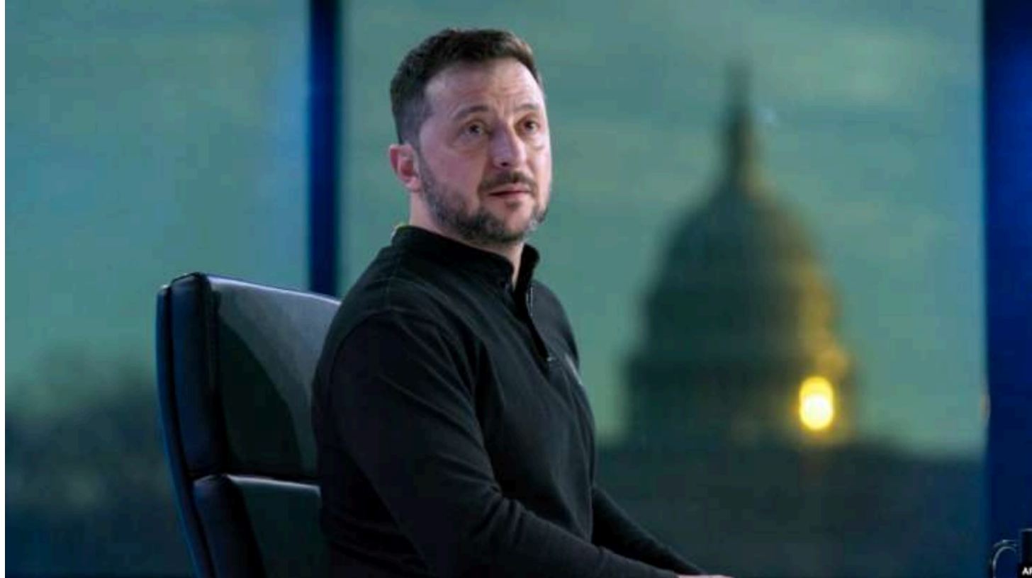
Ілюстративне фото з відкритих джерел

Президент Володимир Зеленський надіслав президенту США Дональду Трампу та Конгресу терміновий лист із попередженням про критичний дефіцит засобів протиповітряної оборони в Україні.