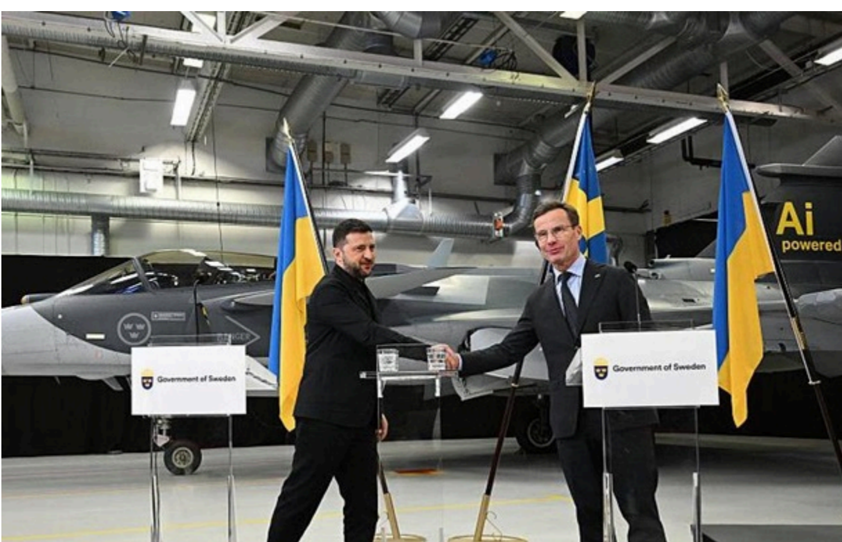
Україна оплатить шведські літаки коштом кредитів ЄС

Перемови щодо майбутнього продажу Україні додаткових літаків, сучасніших Gripen E, також заплановані, пише Aftonbladet.