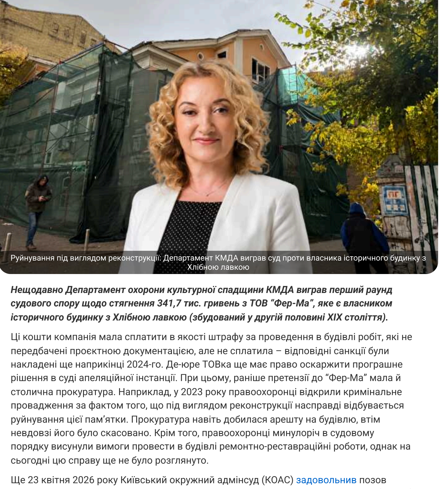
Руйнування під виглядом реконструкції. Департамент КМДА виграв суд проти власника історичного будинку з Хлібною лавкою

Нещодавно Департамент охорони культурної спадщини КМДА виграв перший раунд судового спору щодо стягнення 341,7 тис. гривень з ТОВ «Фер-Ма», яке є власником історичного будинку з Хлібною лавкою (збудований у другій половині XIX століття).