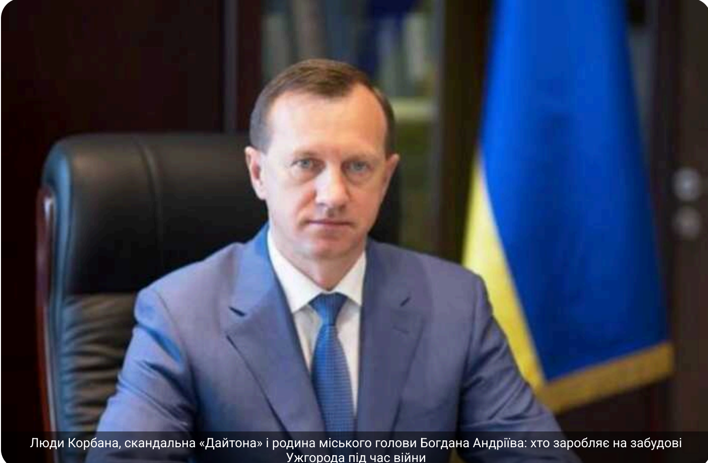
Люди Корбана, скандальна «Дайтона» і родина міського голови Богдана Андрієва: хто заробляє на забудові Ужгорода під час війни

Родина міського голови Ужгород Богдан Андрієв після початку повномасштабного вторгнення активізувала діяльність у сфері забудови міста. За даними журналістів, у співласності колишньої дружини та сина мера перебувають кілька компаній, що займаються будівництвом житлових комплексів бізнес-класу. Один із проєктів, як стверджується, реалізується у партнерстві з оточенням Геннадій Корбан, якого президент Володимир Зеленський у 2022 році позбавив українського громадянства.