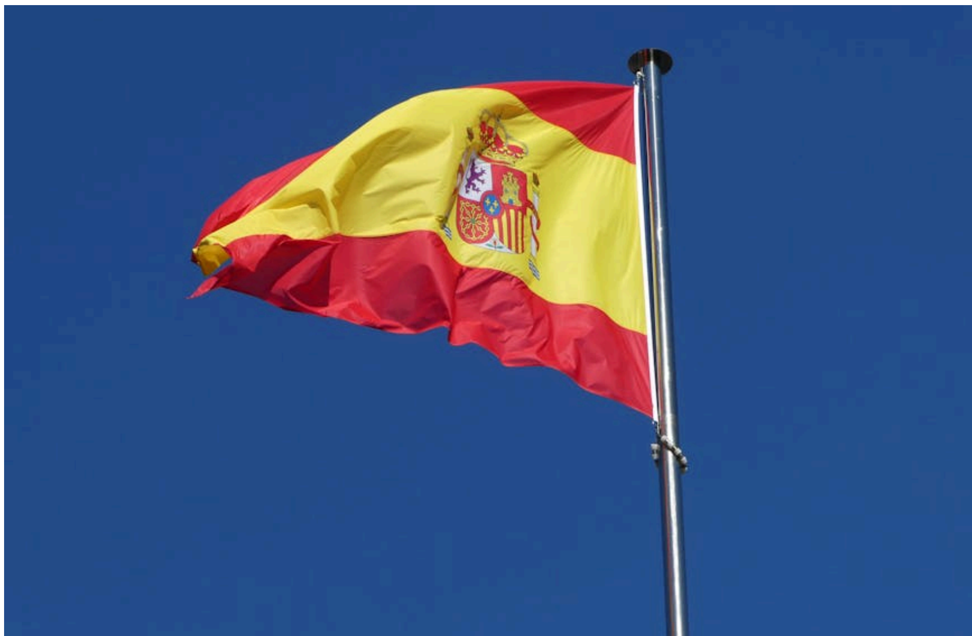
Іспанія / © pexels.com

КАРПЕЦЬ ОЛЕКСАНДР — 27 Травня 2026, 20:05 1 Min Read — ПОЛІТИКА