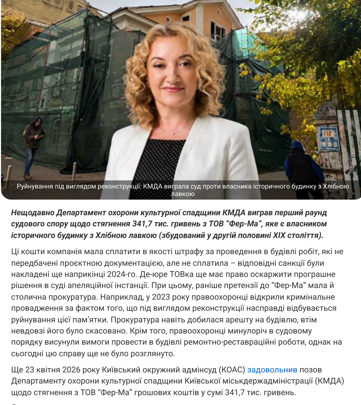
Руйнування під виглядом реконструкції: КМДА виграла суд проти власника історичного будинку з Хлібною лавкою

Нещодавно Департамент охорони культурної спадщини КМДА виграв перший раунд судового спору щодо стягнення 341,7 тис. гривень з ТОВ «Фер-Ма», яке є власником історичного будинку з Хлібною лавкою (збудований у другій половині XIX століття).