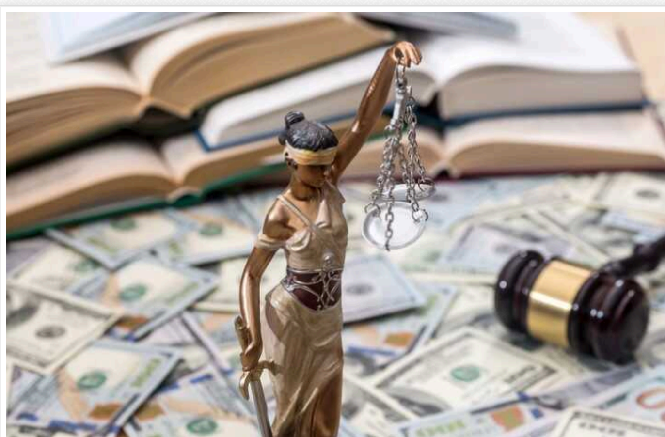
Як Україні повернути мільярди доларів, які були виведені за кордон корупціонерами та шахряями

Повернення коштів, що були виведені з України через корупційні та шахрайські схеми, є одним із ключових завдань у сучасних умовах, оскільки це дозволить забезпечити фінансову підтримку для ЗСУ та української економіки. На жаль, у попередні роки ця робота була абсолютно провалена владою.