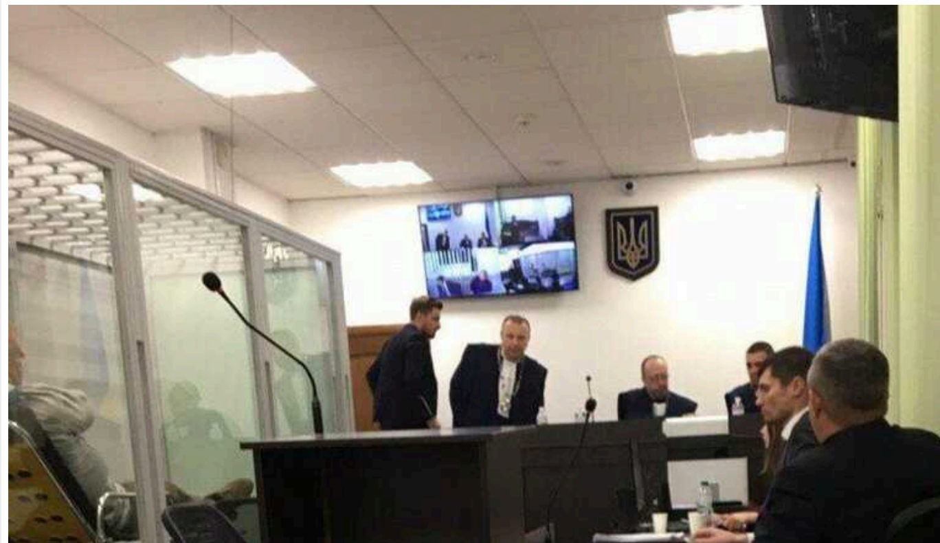
Колишній чиновник ДПЗКУ отримав 10 років в'язниці за корупцію

Вищий антикорупційний суд (ВАКС) призначив 10 років позбавлення волі з позбавленням права обіймати посади на три роки одному з колишніх керівників ПАТ "Державна продовольча зернова корпорація" (ДПЗКУ). Його звинувачують у тому, що у 2014 році разом з іншими посадовими особами реалізував корупційну схему, за якою зерно, що належало ДПЗКУ, продавалося за заниженими цінами одному з міжнародних зернотрейдерів – через мережу підконтрольних приватних компаній-посередників.